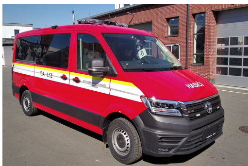
nové auto našich hasičů