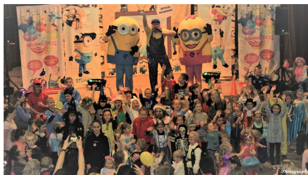
momentka z karnevalu