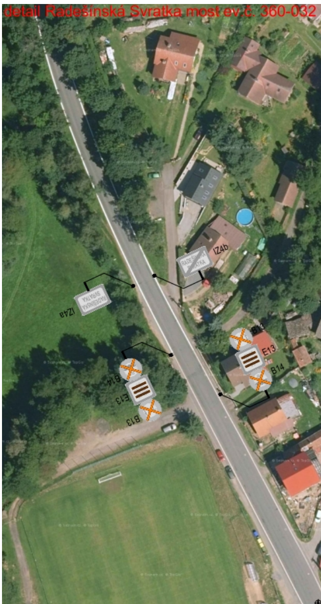
detail Radešinská Svratka most ev.č. 360-032